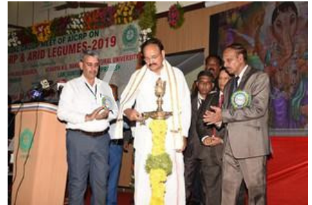
GUNTUR, MAY 19 :- Vice President M Venkaiah Naidu lighting the lamp to inaugurate the Annual Group Meet of AICRP on MULLaRP and ARID Legumes 2019 in Guntur Andhra